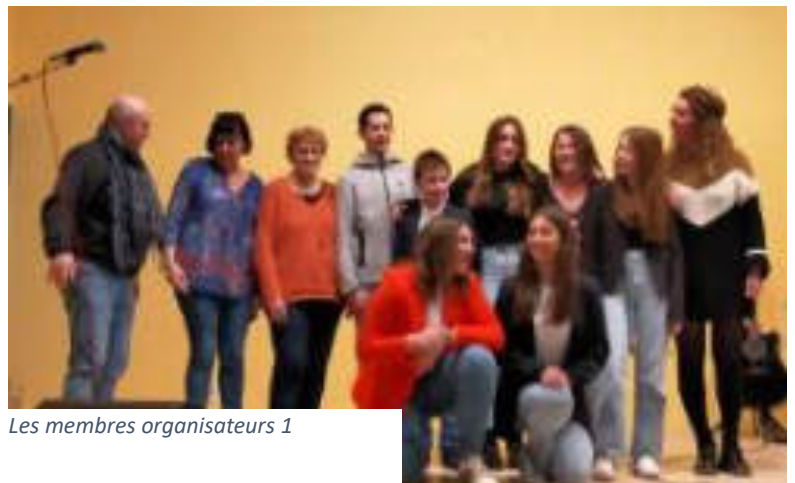
Les membres organisateurs 1

Vous n'avez pas pu venir à cet évènement, pas de panique, les jeunes conseillers de votre CMJ ont promis qu'ils renouvelleraient la soirée en 2025 !