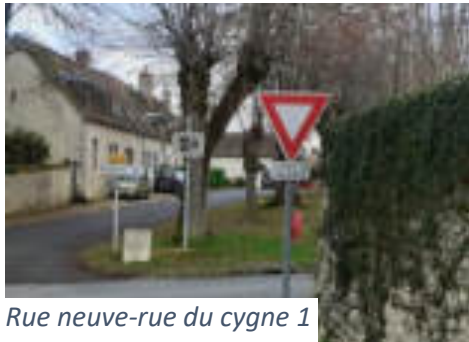
Rue neuve-rue du cygne 1