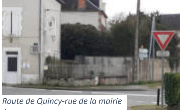
Route de Quincy-rue de la mairie